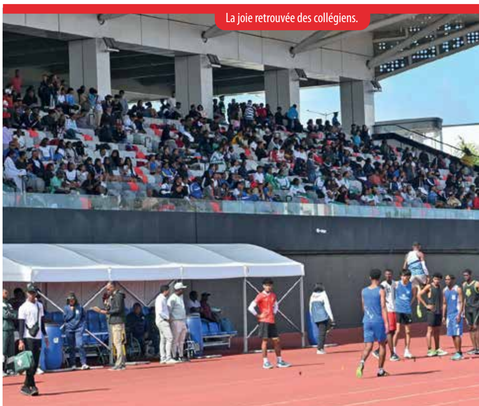
La joie retrouvée des collégiens.

Félicitations à tous les lauréats ainsi qu'à l'ensemble des participants. Rendez-vous est donné pour l'édition 2026.