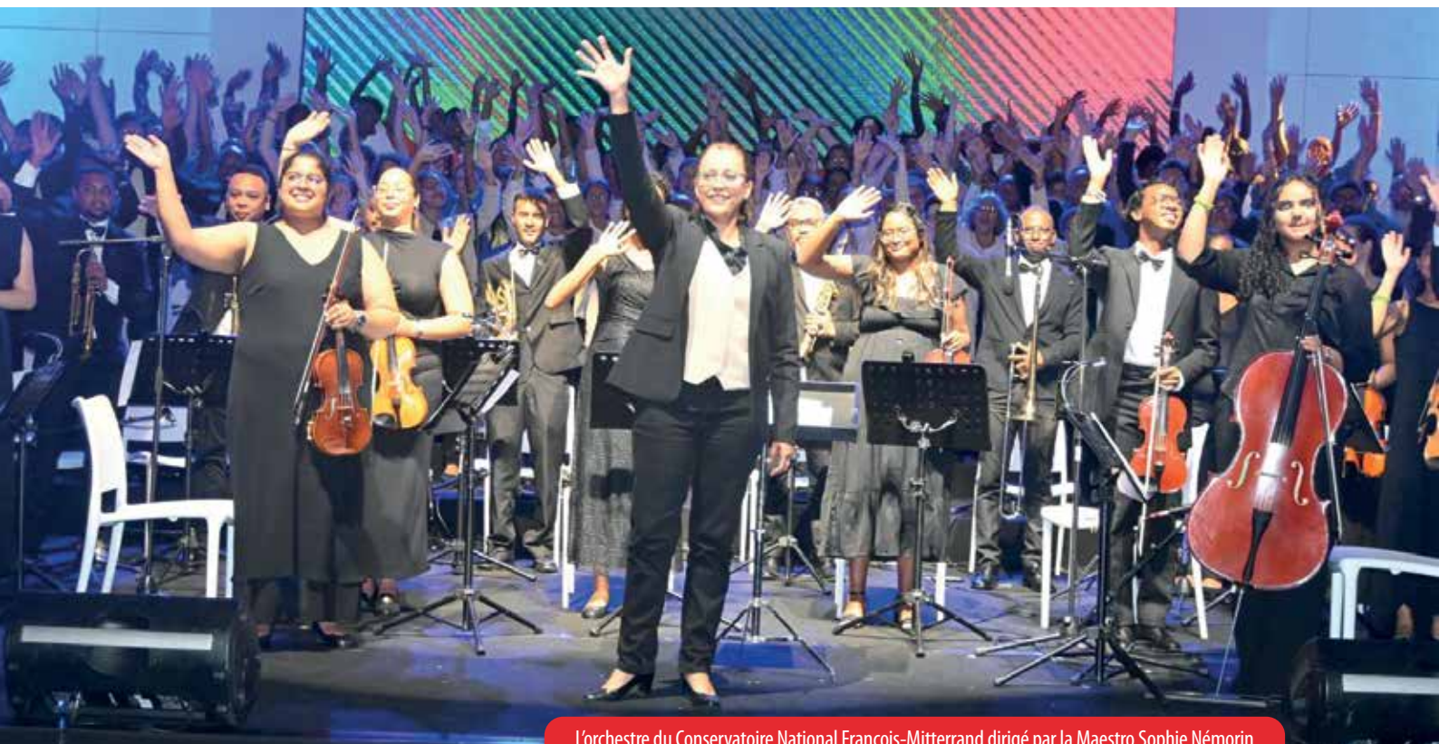
L'orchestre du Conservatoire National François-Mitterrand dirigé par la Maestro Sophie Némorin.