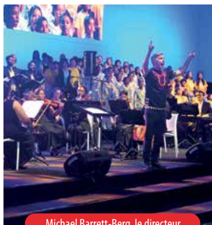
Michael Barrett-Berg, le directeur musical d'Interkultur a assuré le show.

lieu dans les centres commerciaux ainsi que dans d'autres endroits publics. L'île Maurice a, pendant la durée des Jeux, vibré au rythme des centaines de voix de divers pays du monde, mais unies par cette valeur que véhicule le chant choral ; celle de rassembler les gens, au-delà des cultures, du langage et de la géographie.