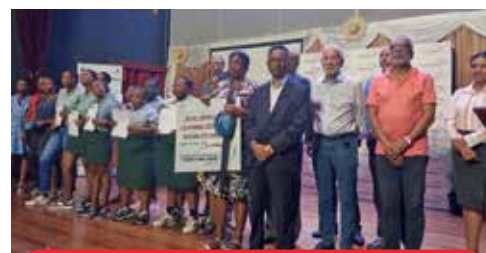
Photo souvenir après la remise de certificats aux participants du Programme Duke of Edinburgh Award.