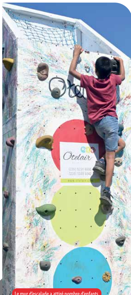
Le mur d'escalade a attiré nombre d'enfants.

Ce programme a permis d'identifier plusieurs talents, dont certains ont intégré des centres de formation spécialisés. Anou Transform Nou Landrwa est aujourd'hui reconnu comme l'un des projets phares du ministère de la Jeunesse et des Sports pour l'année 2025. D'autres éditions sont en préparation pour l'année prochaine.