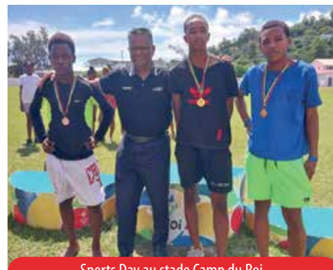
Sports Day au stade Camp du Roi.