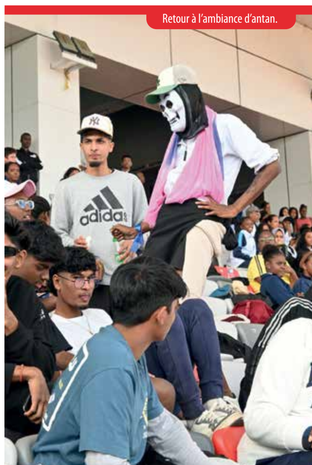
Retour à l'ambiance d'antan.