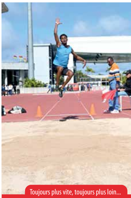
Toujours plus vite, toujours plus loin...