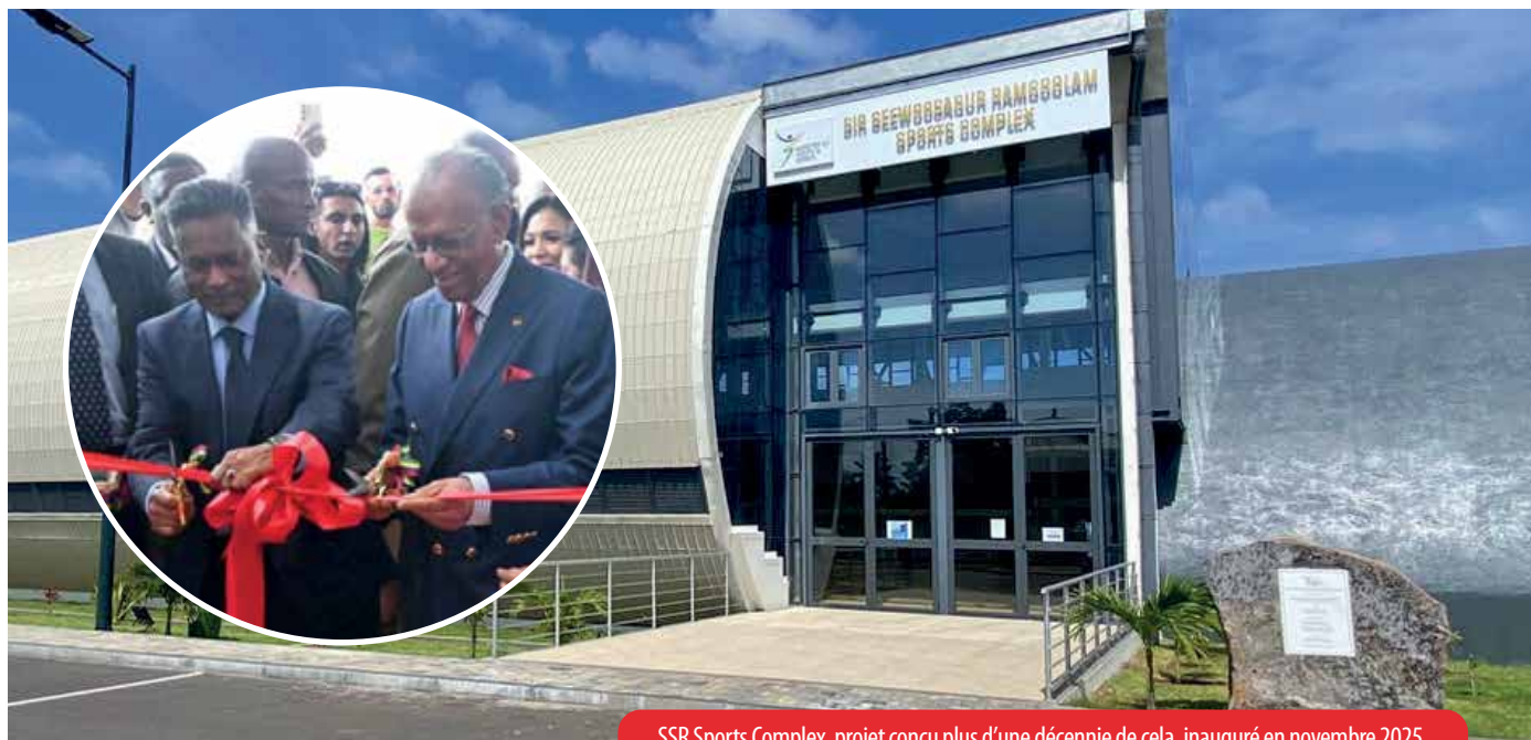
SSR Sports Complex, projet conçu plus d'une décennie de cela, inauguré en novembre 2025.