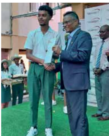
Remise du certificat Duke of Edinburgh Award par le ministre à un participant.