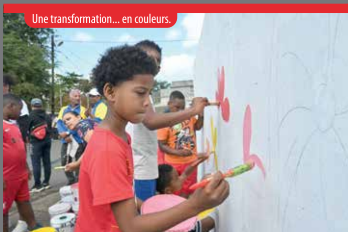
Une transformation... en couleurs.