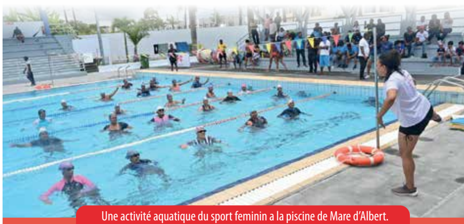
Une activité aquatique du sport féminin à la piscine de Mare d'Albert.

La Commission Nationale du Sport Féminin (CNSF) encourage activement la participation des femmes au sport à Maurice. Au cours de l'année, la CNSF a organisé et soutenu diverses activités, notamment des journées sportives, des galas de natation, des programmes de remise en forme et de loisirs, des séances de sensibilisation et des activités de renforcement des capacités.