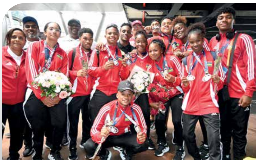
Nos athlètes tout souriants à leur retour au pays.