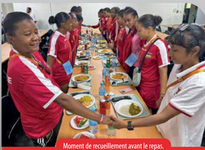
Moment de recueillement avant le repas.