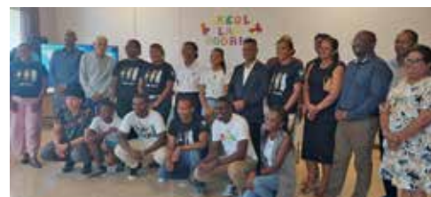
Les élèves de Lékol Lar Rodrig.