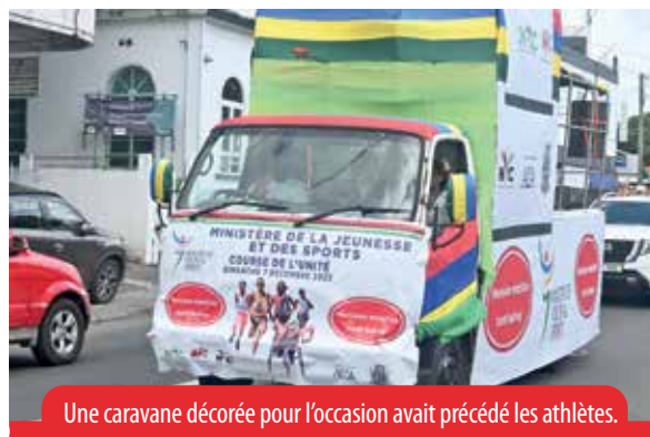
Une caravane décorée pour l'occasion avait précédé les athlètes.