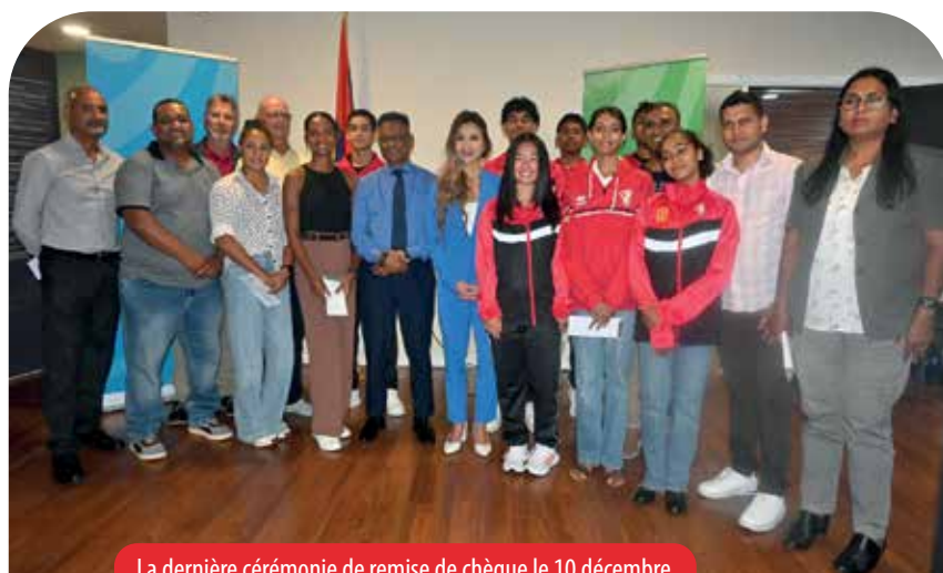
La dernière cérémonie de remise de chèque le 10 décembre.

Les récompenses offertes aux médaillés des Jeux de la Commission de la Jeunesse et des Sports de l'océan Indien (CJSOI) sont incluses dans ces chiffres.