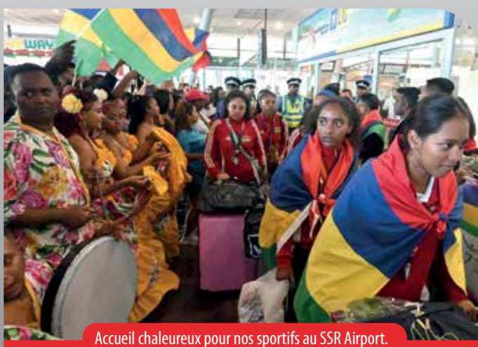
Accueil chaleureux pour nos sportifs au SSR Airport.