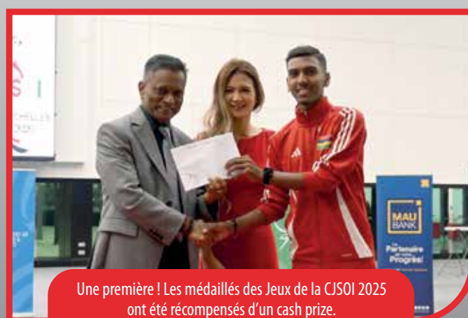
Une première ! Les médaillés des Jeux de la CJSOI 2025 ont été récompensés d'un cash prize.