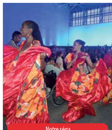
Notre séga à l'honneur.