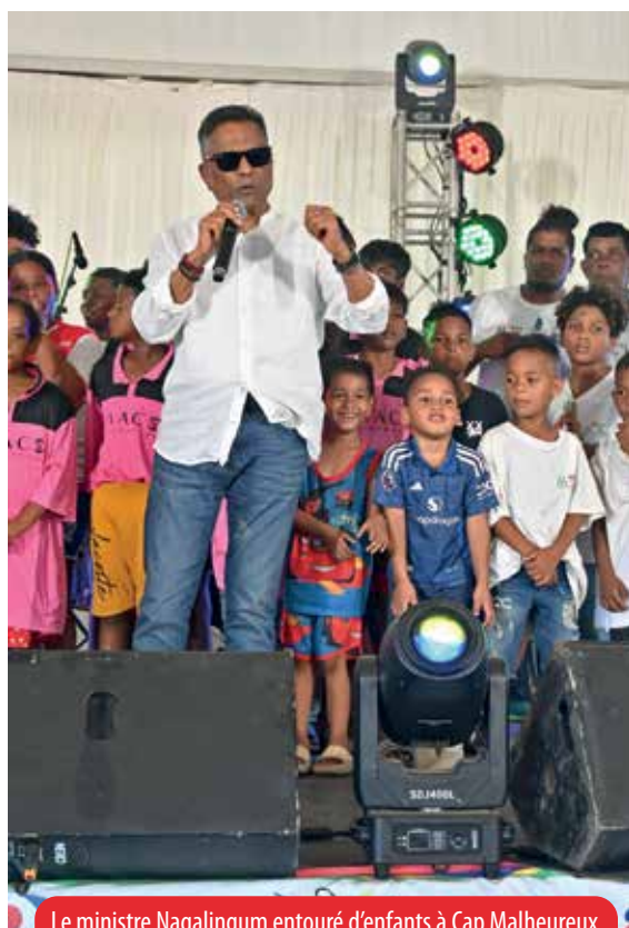
Le ministre Nagalingum entouré d'enfants à Cap Malheureux.