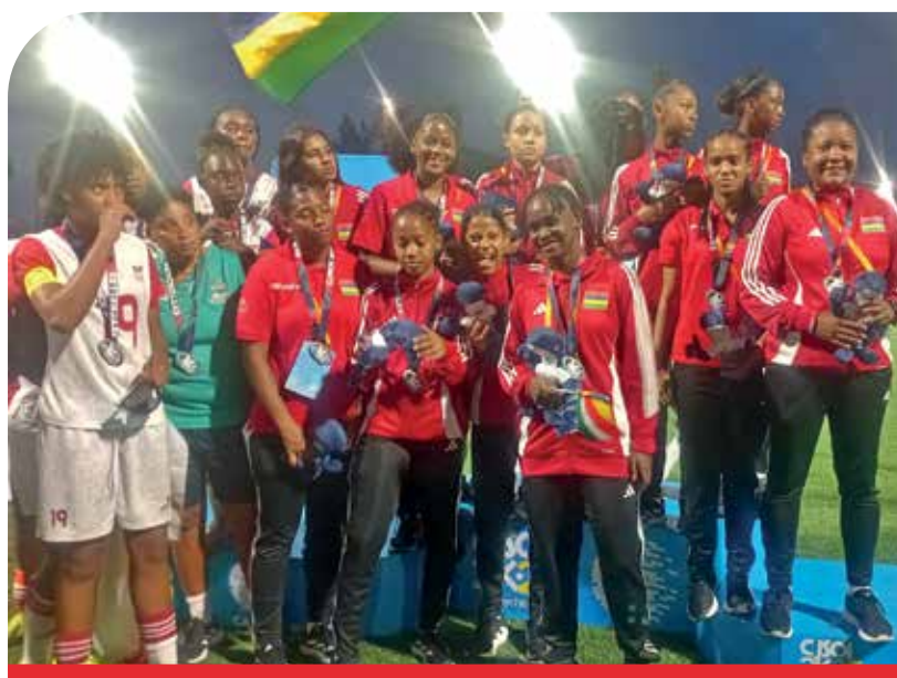
Une médaille d'or stimulante pour nos footballeuses.