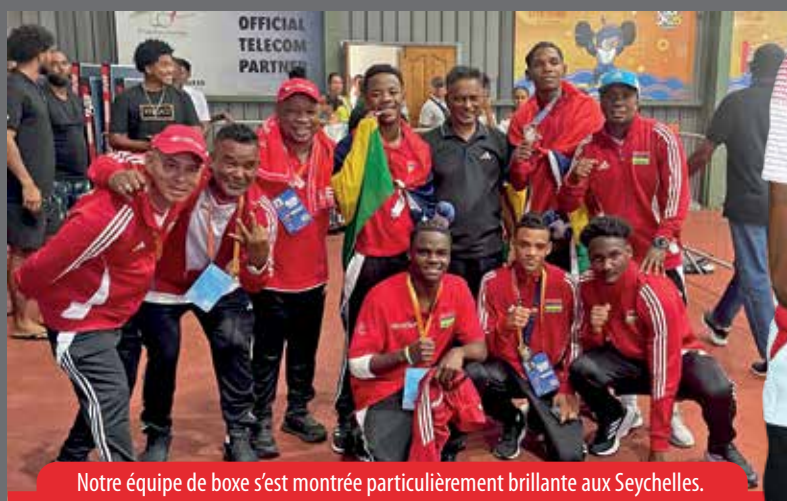
Notre équipe de boxe s'est montrée particulièrement brillante aux Seychelles.