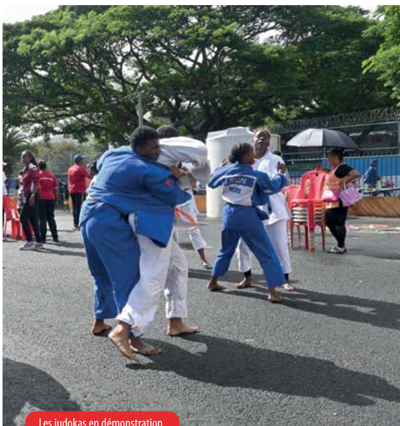
Les judokas en démonstration.