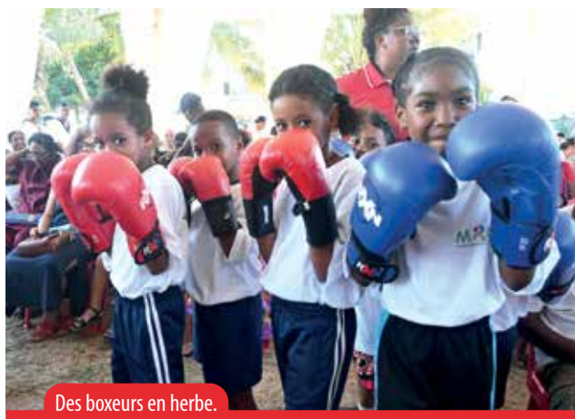
Des boxeurs en herbe.