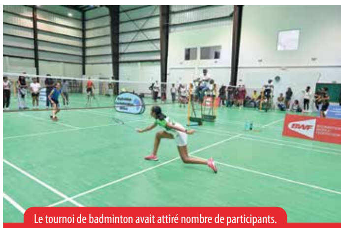
Le tournoi de badminton avait attiré nombre de participants.