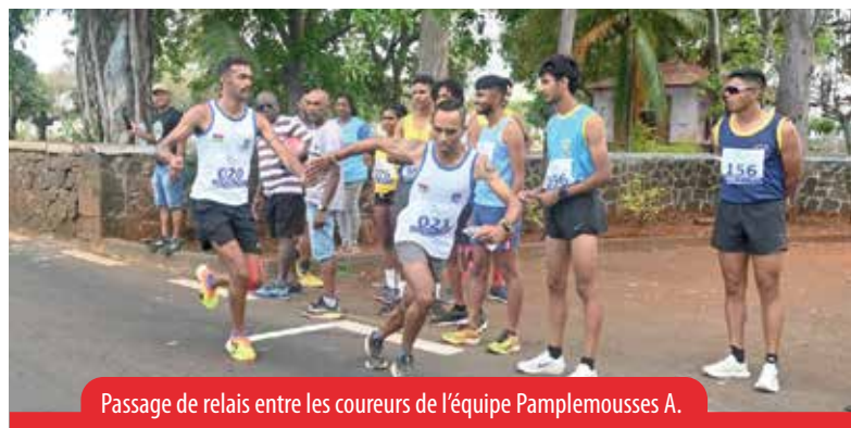
Passage de relais entre les coureurs de l'équipe Pamplermousses A.