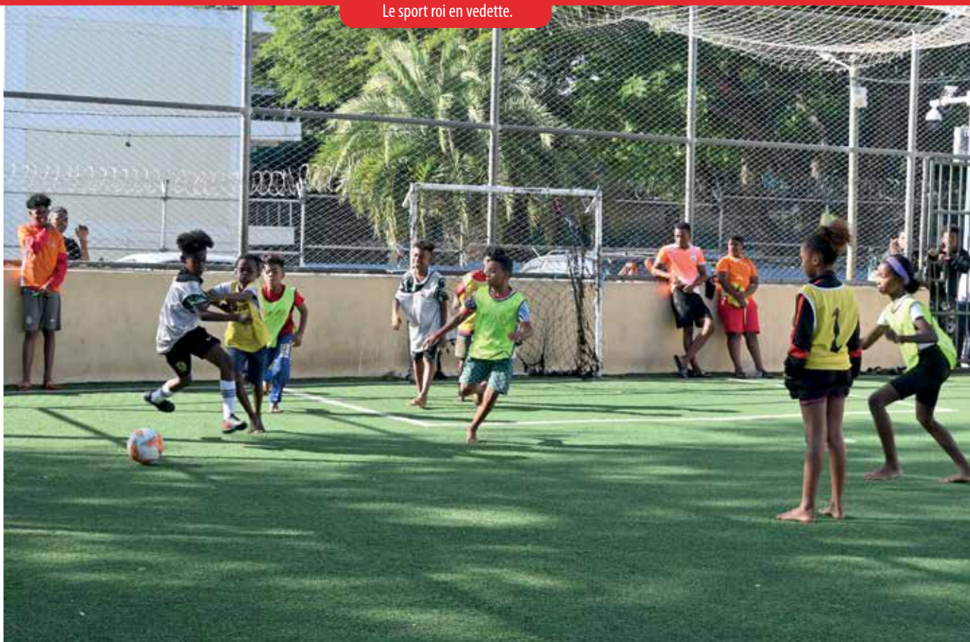
Le sport roi en vedette.